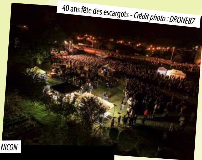
40 ans fête des escargots