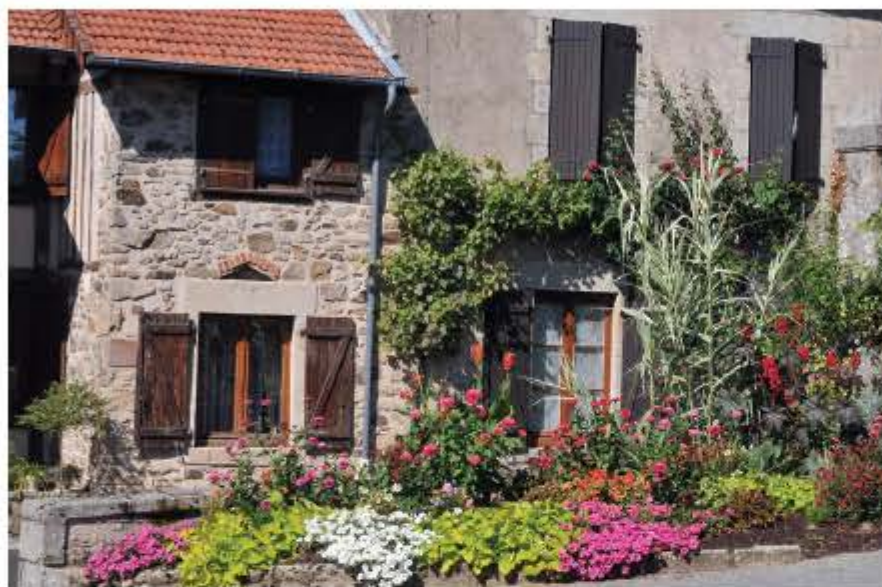
maisons du Vieux Boisseuil

9 Descendre ce chemin creux en terre. Arrivé Chez Barrière, descendre la route à droite, la suivre en remontant jusqu'au bourg de Boisseuil. Au carrefour des écoles, prendre à gauche pour retrouver le parking.