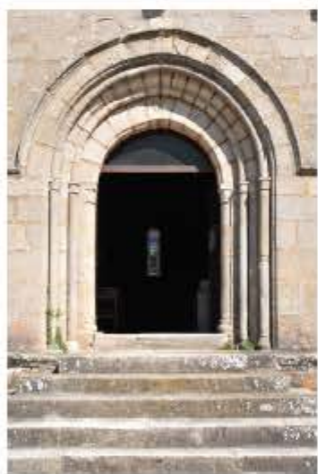
L'église romane Saint-Jacques, du XI ème siècle, se trouvait sur la via lemovicensis (voie limousine), empruntée par les pèlerins de Saint-Jacques de Compostelle.