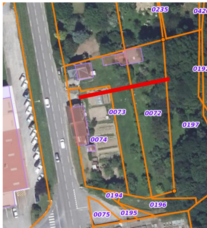
Emplacement de la canalisation

Une canalisation traverse la parcelle AP 72 pour déboucher dans la parcelle AP 197. un regard est situé en limite avec la parcelle AP 73 et permet la localisation de la conduite.