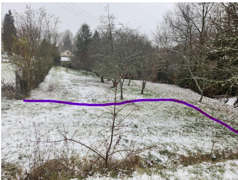
Zone de stationnement à aménager sur les parcelles AP 196 et AP 197

Un décapage de l'accès et une stabilisation seront réalisés. Un espace de stationnement pour les véhicules de services avec deux emplacements PMR pourront être aménagés.