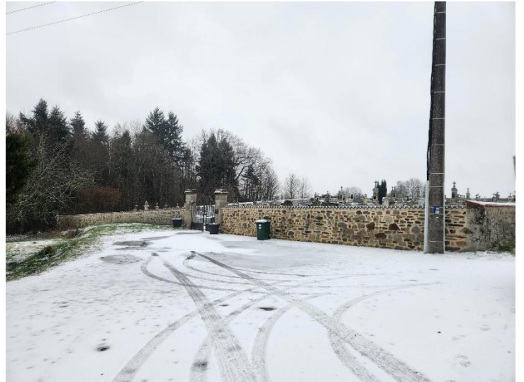
Accès au projet d'extension et parking de l'entrée des Cyprès

Un décapage de l'accès et une stabilisation seront réalisés. Un espace de stationnement pour les véhicules de services avec deux emplacements PMR pourront être aménagés.