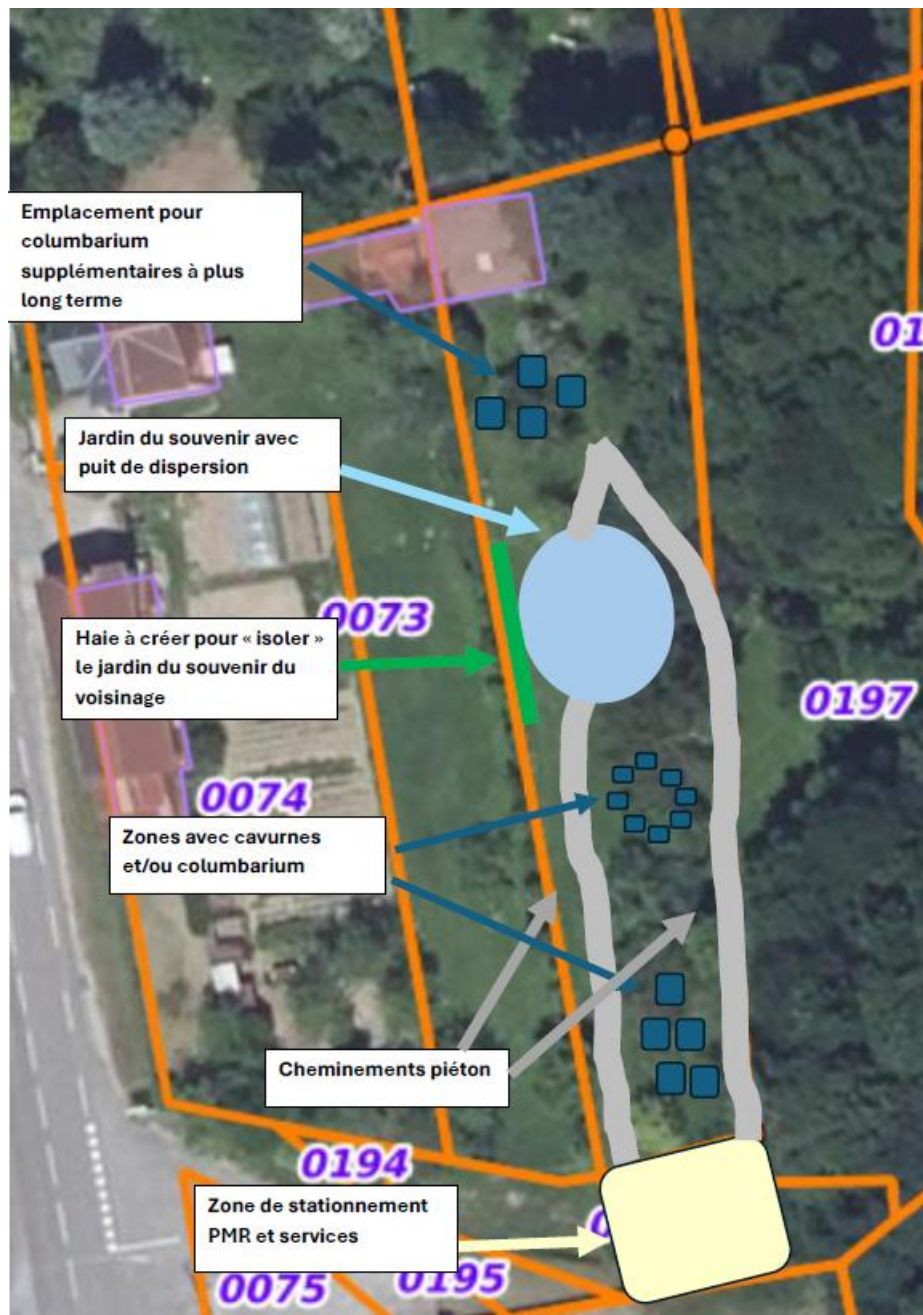
Aménagements envisagés sur la parcelle AP 72