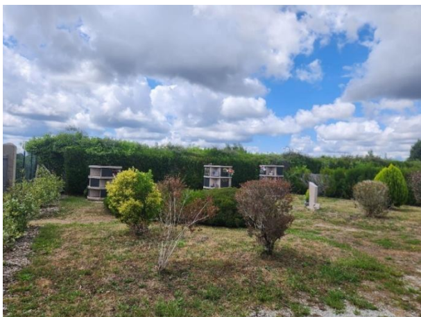
Columbarium et jardin du souvenir

Le projet d'extension envisagé a pour but de corriger cette situation.