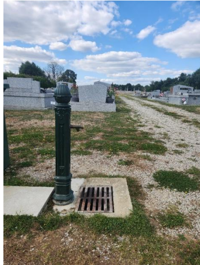
Fontaine installée en 2024

La commune mène depuis 3 ans une action de rénovation de ces espaces (meilleures signalisation, réfection du parking de l'entrée des Acacias, installation de fontaines, végétalisation).