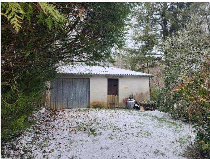
Bâtiment présent sur la parcelle AP 72

Elle comporte une construction existante, une sorte de hangar d'une surface approximative de 55m 2 .