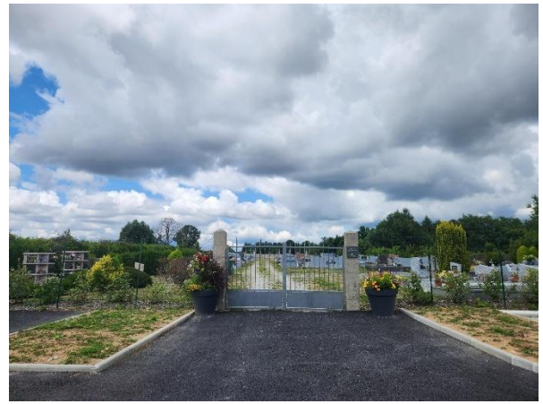
Photo de gauche entrée des cyprès et photo droite entrée des acacias

L'entrée des Cyprès comporte un petit espace de stationnement d'environ 120m 2 .