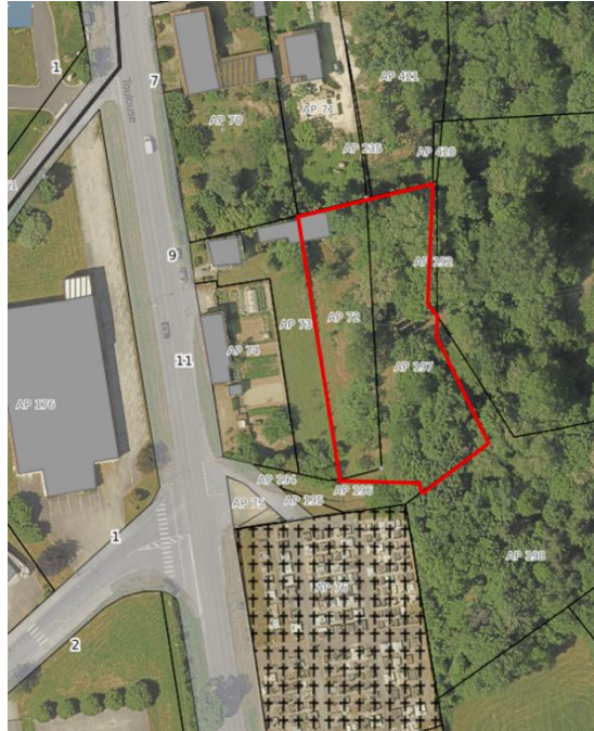
Emprise du projet d'extension

Les parcelles envisagées pour l'extension du cimetière qui permettra la création d'un site cinéraire sont les parcelles AP 72 et AP 197.