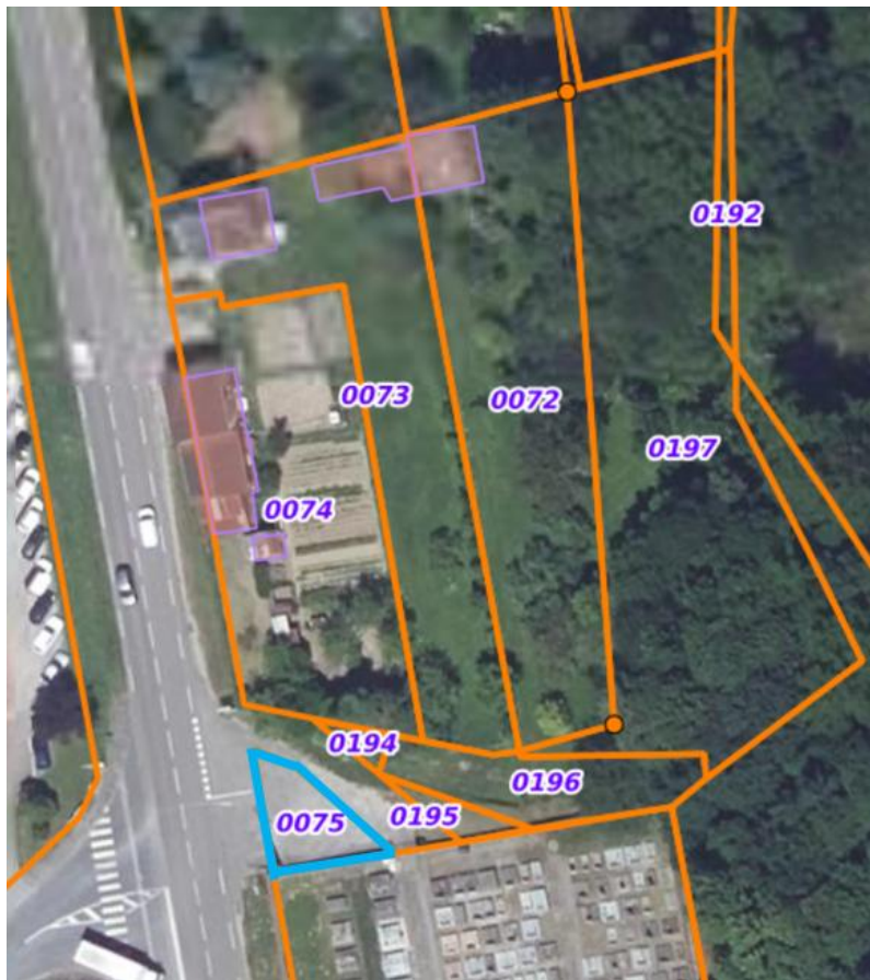
Parcelle constituant le parking de l'entrée des cyprès, à acquérir

Dans le cadre de la procédure en cours, il sera proposé aux propriétaires de la parcelle AP 75, qui constitue une partie du parking de l'entrée des cyprès, de régulariser la situation par une cession à la commune. Des recherches sont en cours sur le/les propriétaire(s).