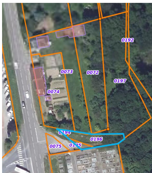
Parcelles à acquérir pour aménager l'accès et le parking

Afin de faciliter l'accès au futur site cinéraire, et même si une servitude de passage existe, les parcelles AP 195, 196 et 197 seront achetées aux propriétaires actuels. Ceux-ci ont été contactés en vue du projet et sont favorables à la cession à la commune.