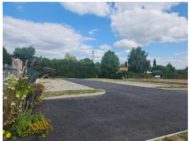
Photo de gauche : parking entrée des cyprès et photo de droite : parking entrée des acacias

La partie ancienne comporte 283 concessions, elles sont toutes occupées ou acquises par des particuliers.