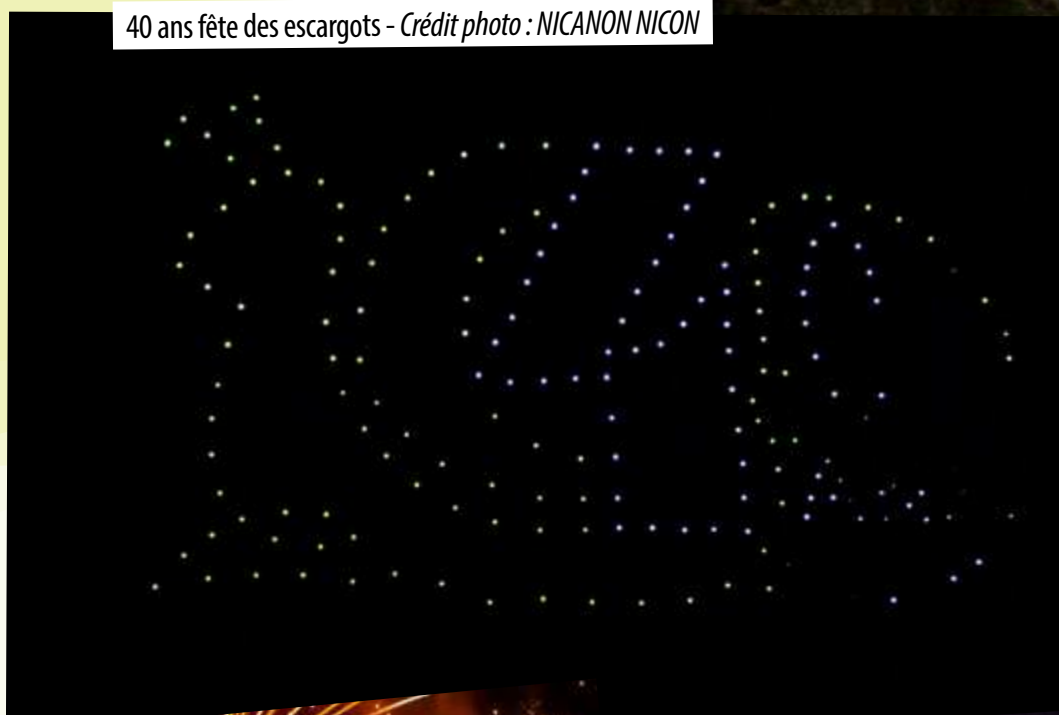
40 ans fête des escargots