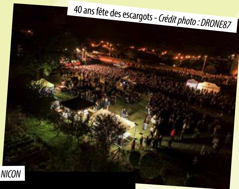
40 ans fête des escargots - Crédit photo : DRONE87