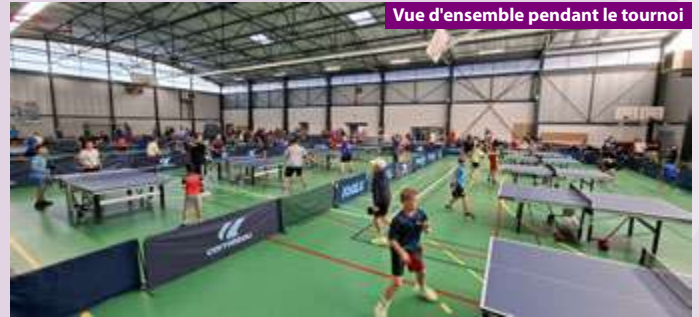
Vue d'ensemble pendant le tournoi

Pendant ces journées, nous vous invitons à venir découvrir notre sport et voir l'enthousiasme de tous ces compétiteurs.