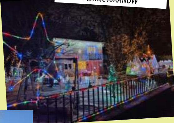
Maison illuminée vieux Boisseuil Famille KIKANOW