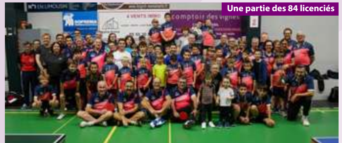
Une partie des 84 licenciés

Une tenue sportive est en cours de préparation, cela fait longtemps que nous souhaitons en proposer une nouvelle.