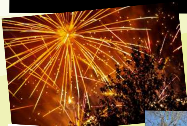
40 ans fête des escargots