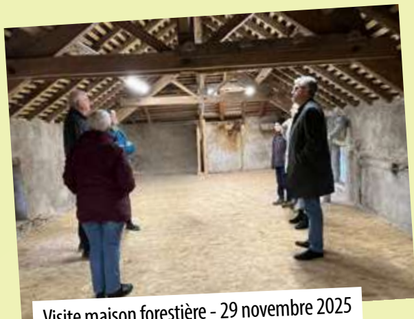
Visite maison forestière - 29 novembre 2025