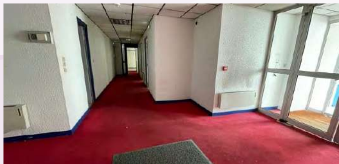
Hall d'entrée du futur Centre LGBTI+Lim'Bow