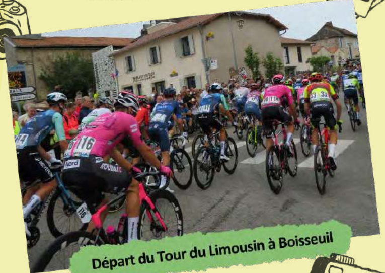
Départ du Tour du Limousin à Boisseuil