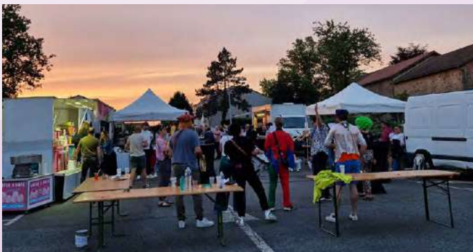
Ciné plein air

Il organise, avec le soutien de la commune, la vie associative et de nombreuses manifestations.