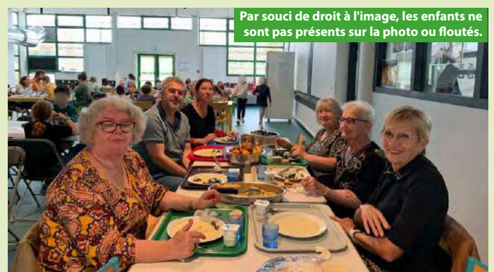
Par souci de droit à l'image, les enfants ne sont pas présents sur la photo ou floutés.

Le premier déjeuner au restaurant scolaire a eu lieu le mardi 6 novembre. Quatre personnes âgées de plus de 65 ans, résidentes de Boisseuil, s'étaient inscrites auprès de l'accueil de la mairie, avaient signé la charte de fonctionnement de la cantine intergénérationnelle.