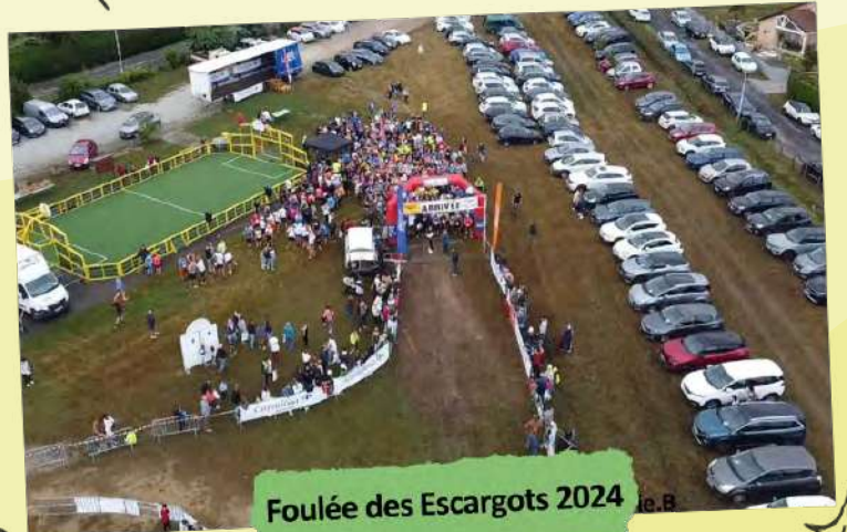
Foulée des Escargots 2024