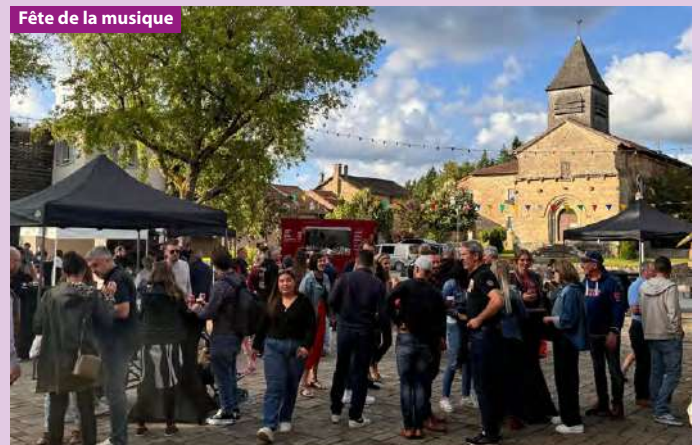
Fête de la musique