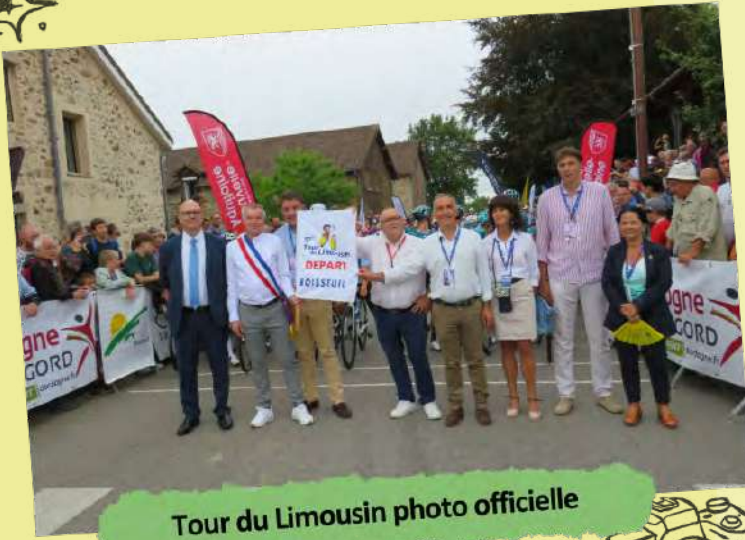
Tour du Limousin photo officielle