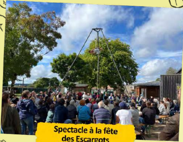
Spectacle à la fête des Escargots