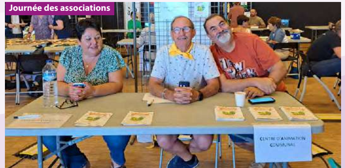
Journée des associations

associations, la traditionnelle foire aux escargots et ses foulées... Bref de bons moments de fête, de convivialité et de partage !