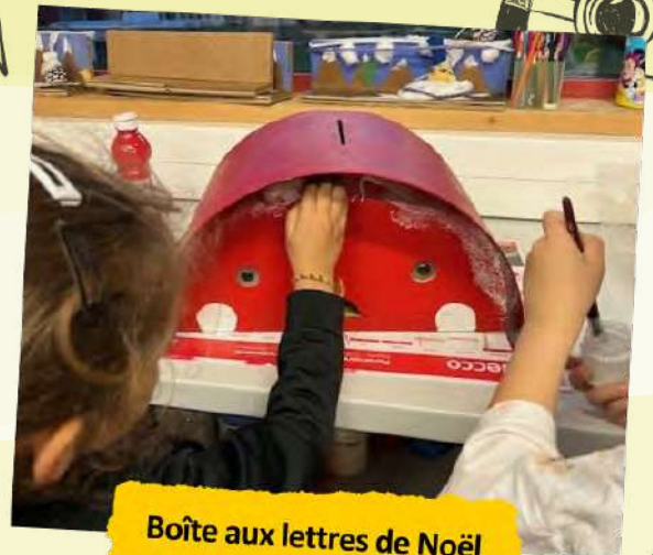
Boîte aux lettres de Noël