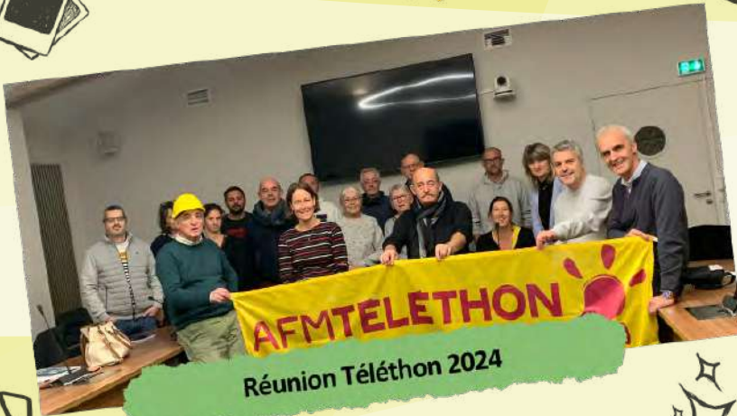
Réunion Téléthon 2024