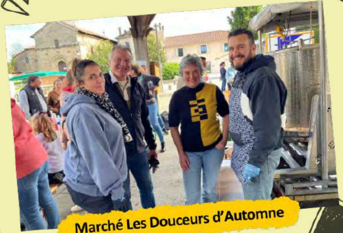
Marché Les Douceurs d'Automne