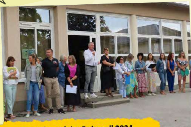
Rentrée scolaire Boisseuil 2024