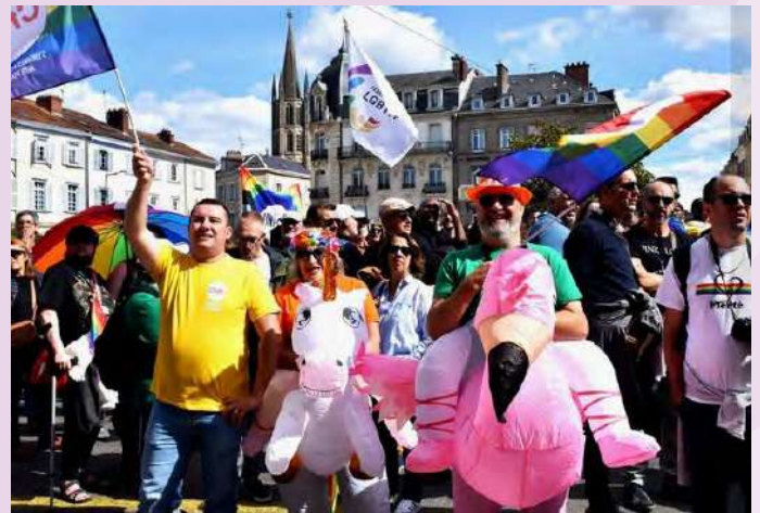
La CFDT en licornes

Si nos actions vous intéressent et que vous souhaitez en savoir plus, vous pouvez me joindre et je vous répondrai avec grand plaisir !