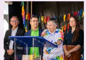
Discours des Institutionnels