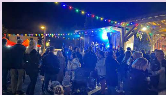
Foire aux escargots