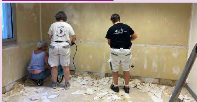
Travaux dans le centre, aidés par SV Peintures de Boisseuil