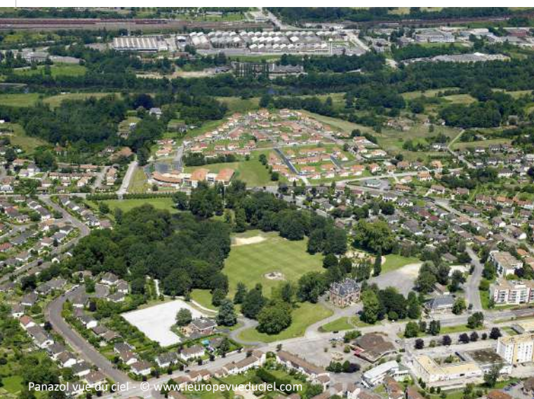
Panazol vue du ciel