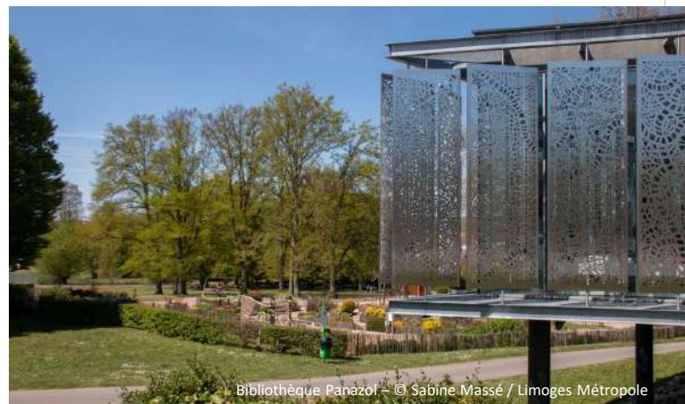
Bibliothèque Panazol