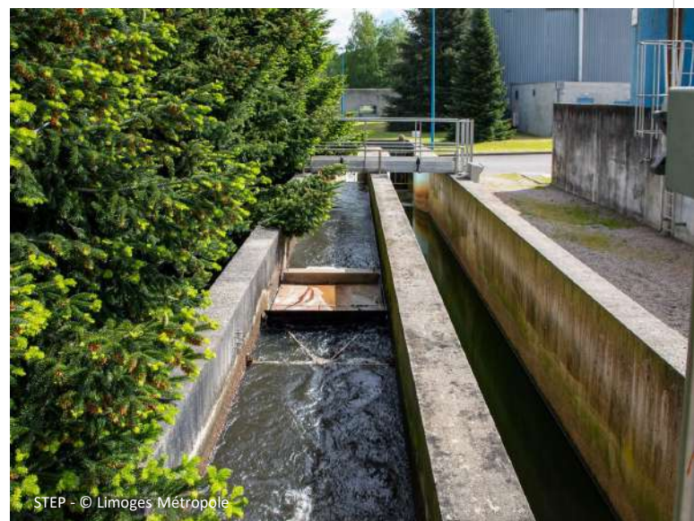
STEP - © Limoges Métropole