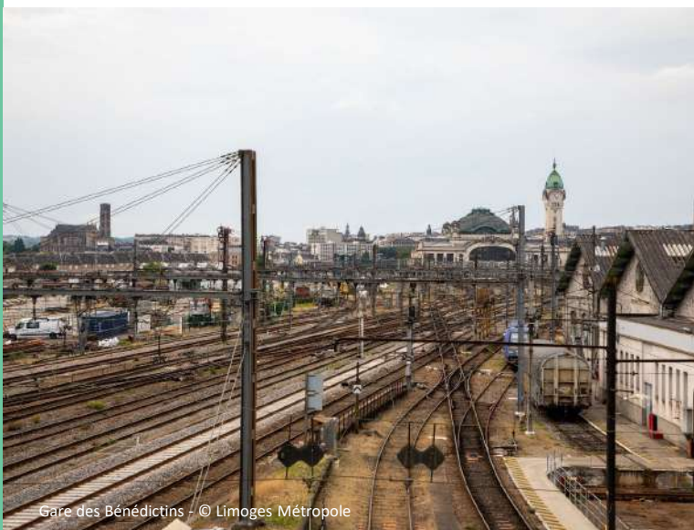
Gare des Bénédictins