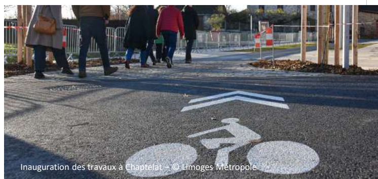
Inauguration des travaux à Chaptelat