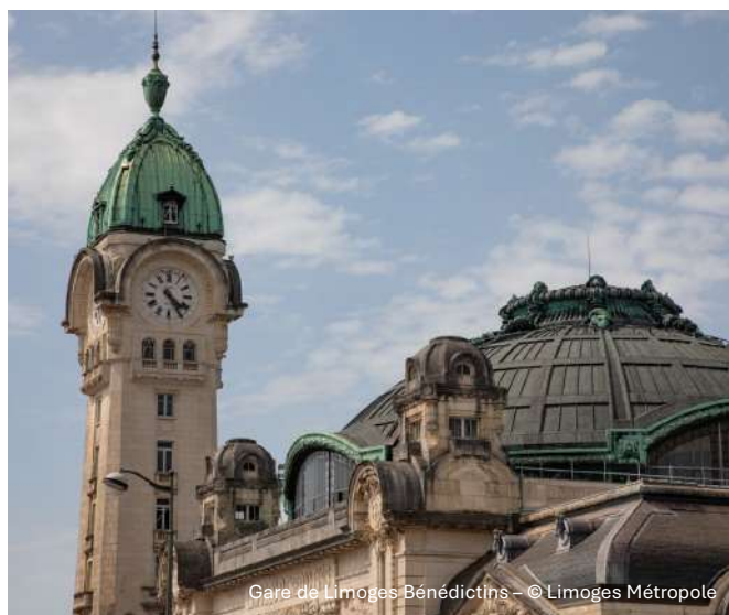
Gare de Limoges-Bénédictins