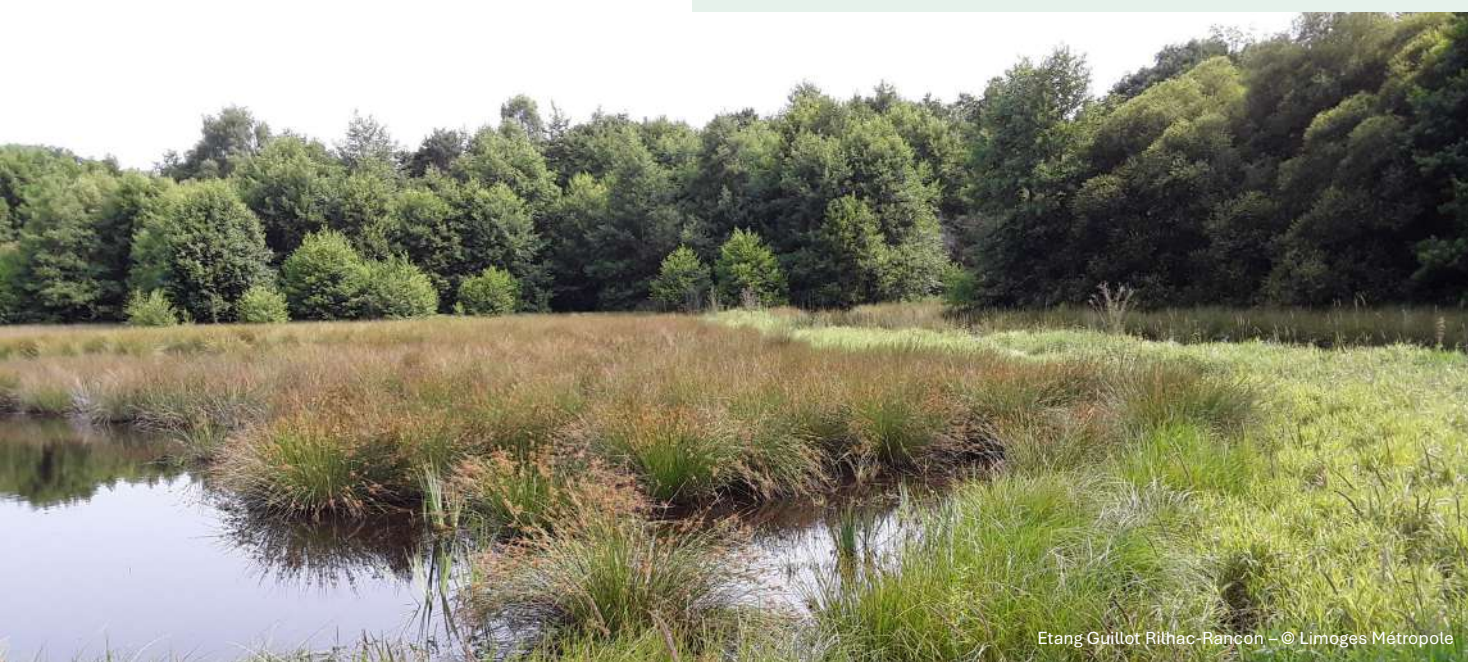
Etang Guillot Rilhac-Rancon

Cette prise en compte globale entend être poursuivie pour chacun des enjeux de l'adaptation du territoire, afin de permettre à Limoges Métropole de développer un urbanisme vertueux et résilient. Dans cet objectif, Limoges Métropole continuera d'appliquer la méthode Éviter, réduire, compenser (ERC).