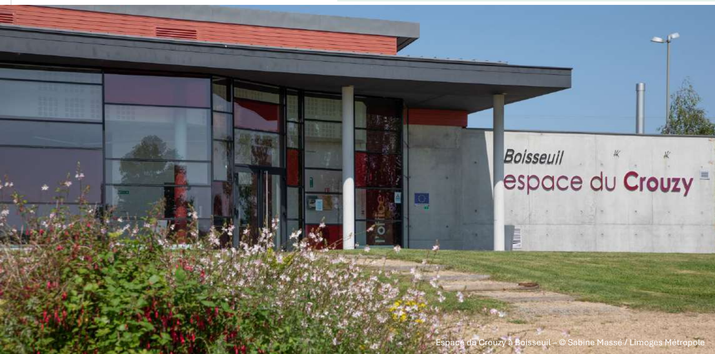
Espace du Crouzy à Boisseuil

Le renforcement des centralités du territoire et l'accompagnement vers une mixité des fonctions est une ambition vertueuse de Limoges Métropole. Le renouvellement urbain et l'amélioration de l'habitat (privilégiant des projets de réhabilitations globales avec des matériaux adaptés) sont des priorités. Cela devra s'accompagner d'un développement de mobilités moins dépendantes de la voiture pour accéder à l'offre de services des polarités existantes, en s'appuyant notamment sur les modes actifs et le transport en commun routier et ferroviaire.