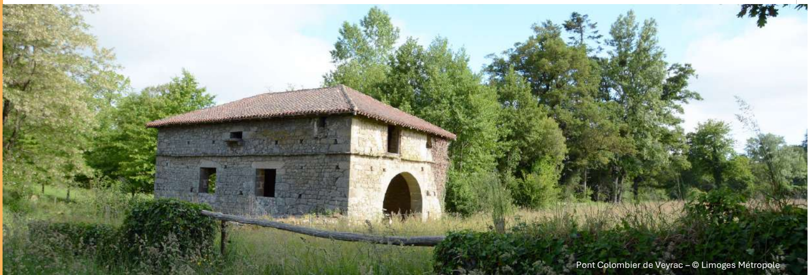
Pont Colombier de Veyrac