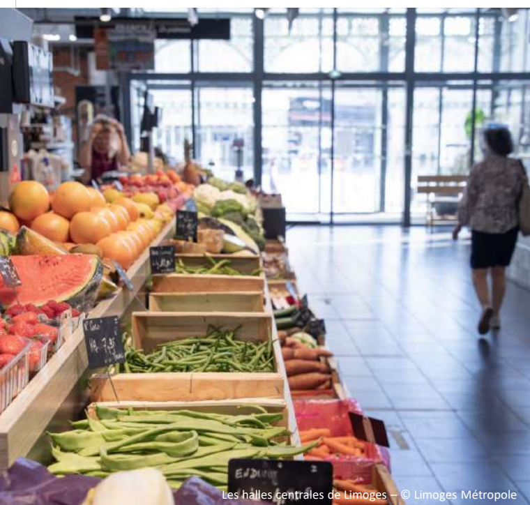
Les halles centrales de Limoges