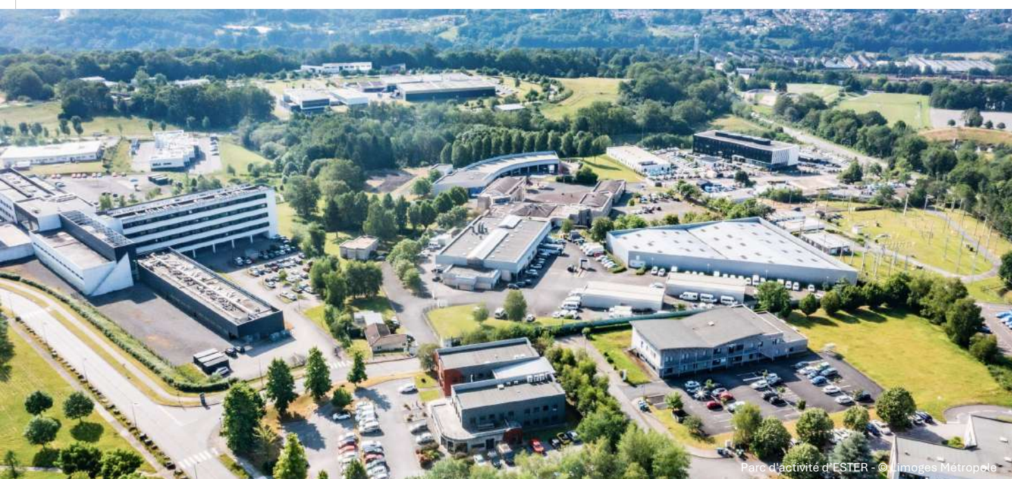
Parc d'activité d'ESTER

4.2 Développer une stratégie foncière efficiente au profit d'une qualité urbaine et d'une limitation de l'extension urbaine .