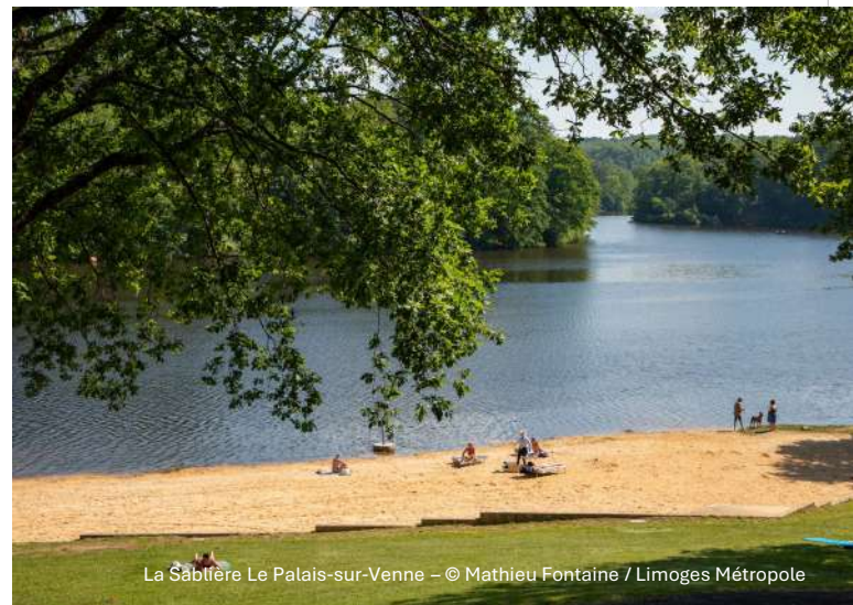
La Sâblière Le Palais-sur-Venne