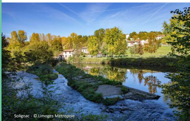
Solignac - © Limoges Métropole