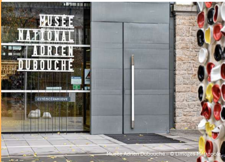
Musée Adrien Dubouché