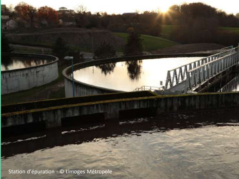
Station d'épuration