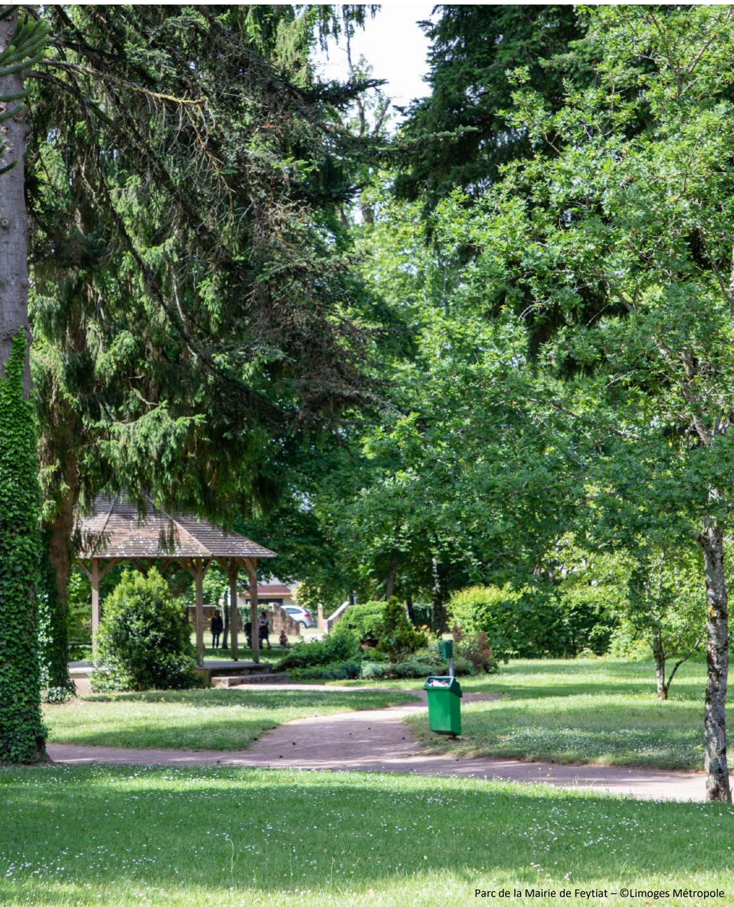
Parc de la Mairie de Feytiat