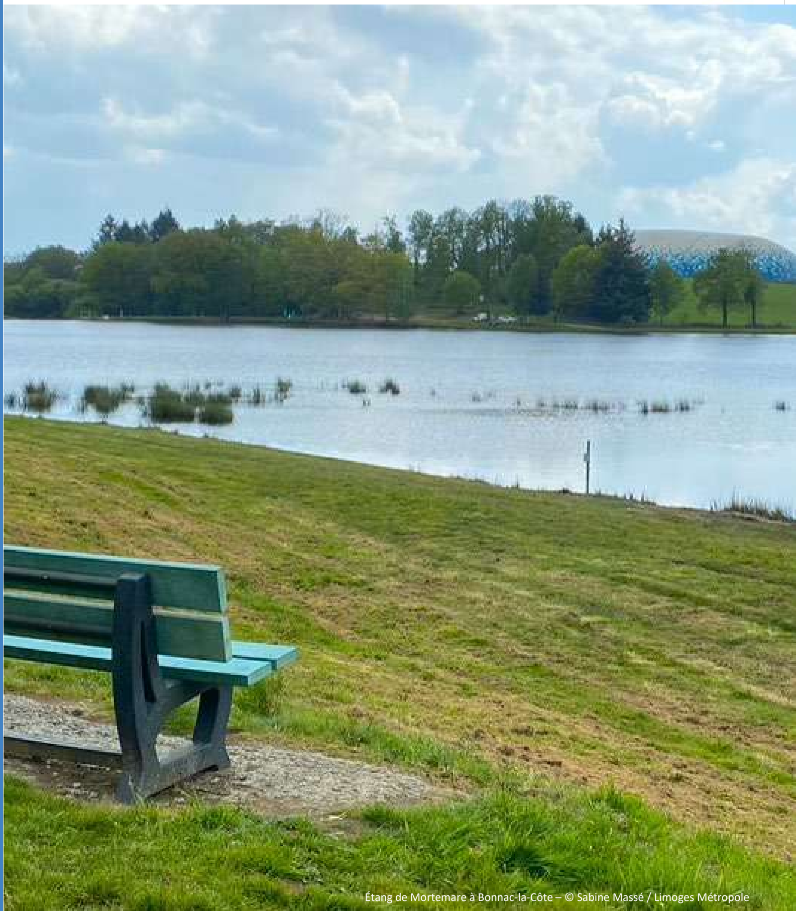
Étang de Mortemare à Bonnac-la-Côte