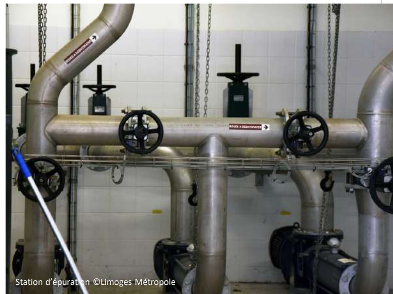
Station d'épuration