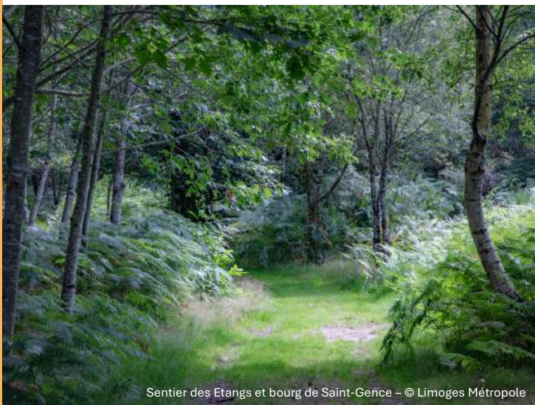
Sentier des Etangs et bourg de Saint-Gence