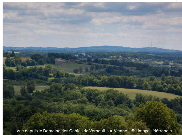
Vue depuis le Domaine des Gabies de Verneuil-sur-Vienne