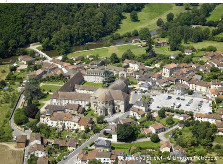
Solignac vu du ciel