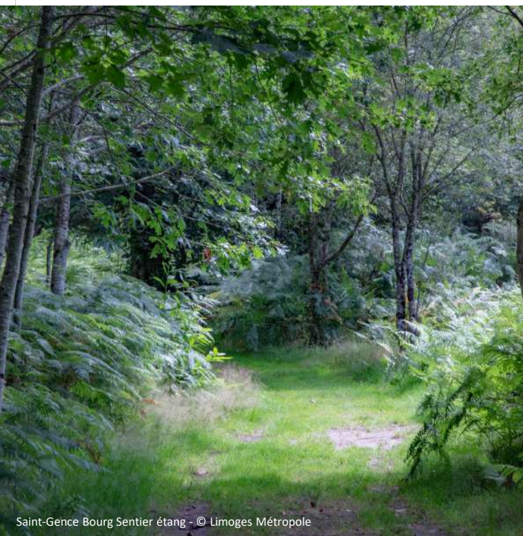
Saint-Gence Bourg Sentier étang