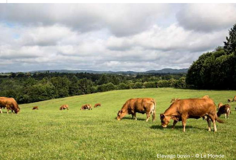
Elevage bovin