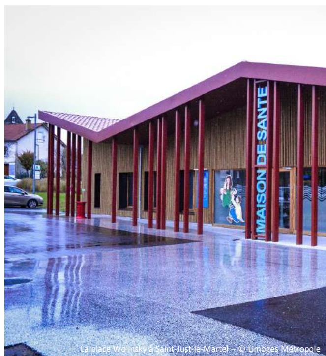
La place Wolinsky à Saint-Just-le-Martel