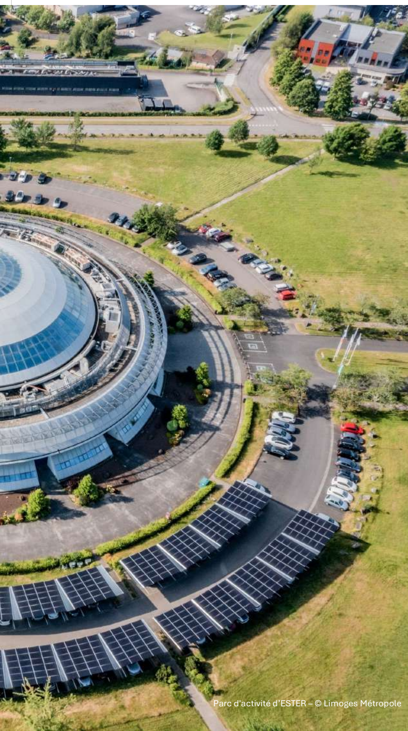
Parc d'activité d'ESTER

Forte de ses filières d'excellence, Limoges Métropole ambitionne de faire de l'innovation un moteur pour le développement et l'attractivité du territoire.