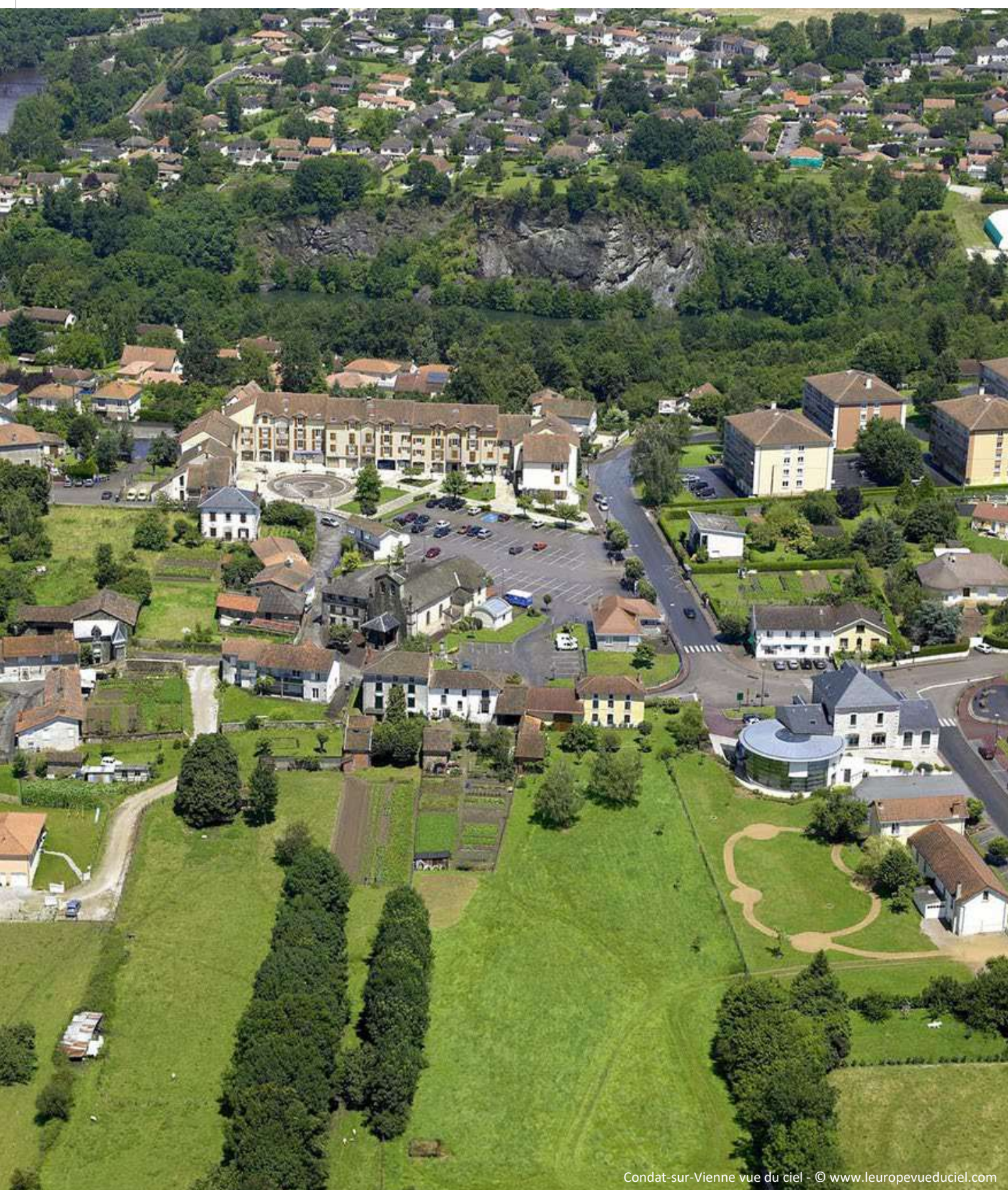
Condat-sur-Vienne vue du ciel