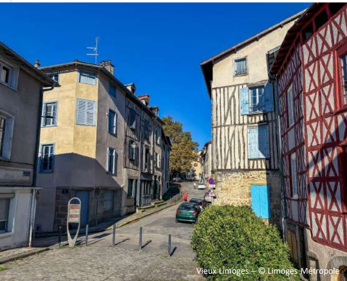
Vieux Limoges – © Limoges Métropole