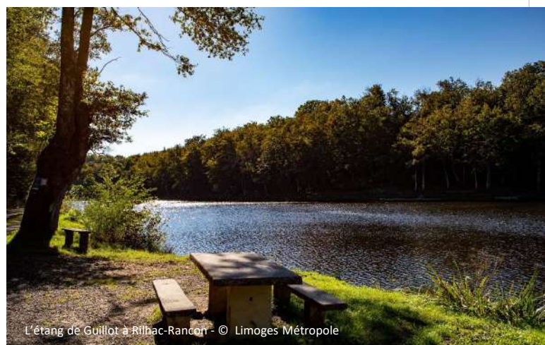
L'étang de Guillot à Rilhac-Rancourt