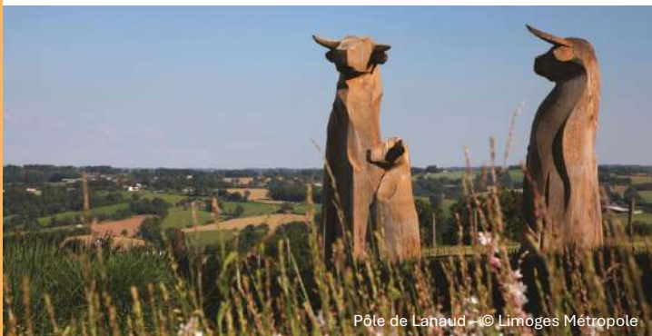
Pôle de Lanaud