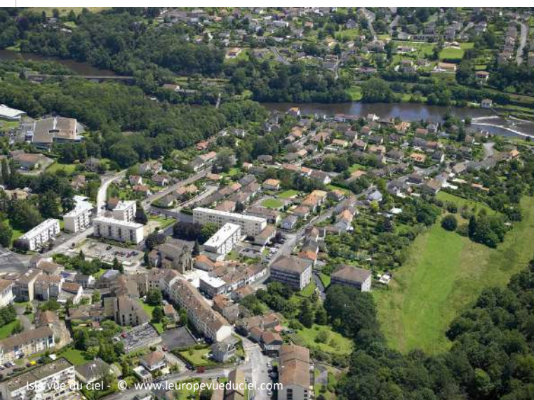
Isle vue du ciel - © www.leuropevueduciel.com