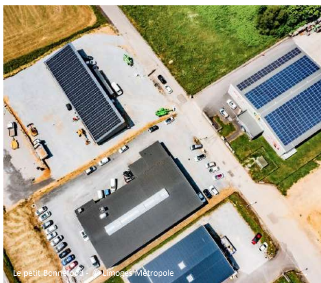
Le petit Bonnet - © Limoges Métropole