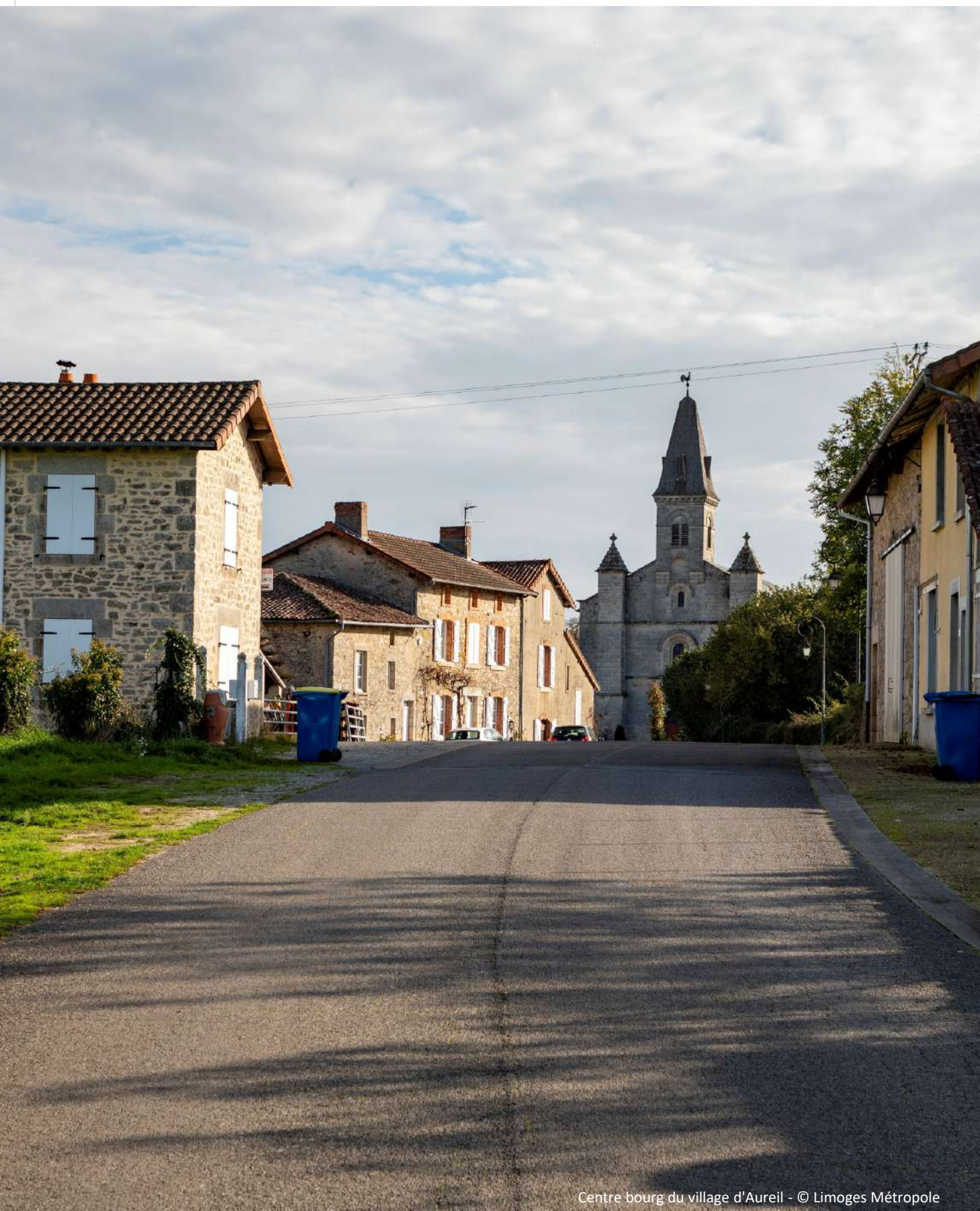
Centre bourg du village d'Aureil